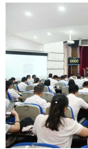
公司召开2023年上半年经济运行分析会。

吴桂英一行在泛海统联研发生产基地进行拉练观摩。吴桂英一行在泛海统联研发生产基地进行拉练观摩。吴桂英一行在泛海统联研发生产基地进行拉练观摩。