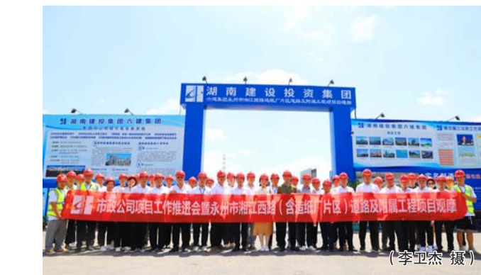
永州市湘西西路（含造纸厂片区道路）及附属工程观摩暨经验交流会现场。

据悉，永州市湘西西路（含造纸厂片区道路）及附属工程项目，总长1997米，标准路幅宽度36米，城市主干道，双向六车道，其中还包含两条支路（桃园路、支路一）。建设内容包括路基、路面、排水、人行道、绿化、亮化、景观等工程。该项目是永州市重点城建项目和重要民生工程，建成后将助推永州市“一江两岸”的发展，改善沿路居民的出行和休闲环境，进一步彰显永州生态、人文特色，提升城市活力和影响力。（李卫杰）