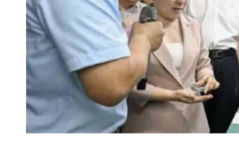
7月22日，长沙市举行半年度重点工作拉练点评暨三季度重大项目集中开工活动。集中开工