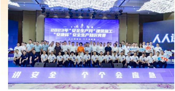
6月26日，以“人人讲安全，个个会应急”为主题的“安全生产月”建筑施工“安康杯”安全生产知识竞赛颁奖现场。

此次竞赛活动由湖南省住房和城乡建设厅主办，湖南省建设工程质量安全监督总站、湖南省建设工程质量安全协会共同承办，湖南省住建厅党组成员、副厅长于艳芳出席。本次竞赛由全省14个市州住建局及湖南建投、中建五局、五矿二十三冶、水电八局、中铁城建5个企业共19支队伍114名选手参加比赛。