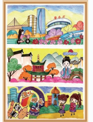
《长沙city》刘锦汐 10岁 家长 二分公司 蔡姝