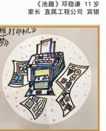
《梦想打印机》曹雅雯 8岁 家长 市政公司 郭俊