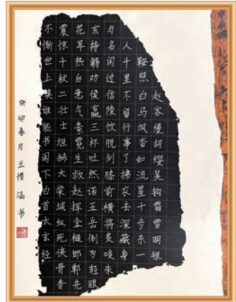
《侠客行》兰惜涵 9岁 家长 设计分公司 兰叶青