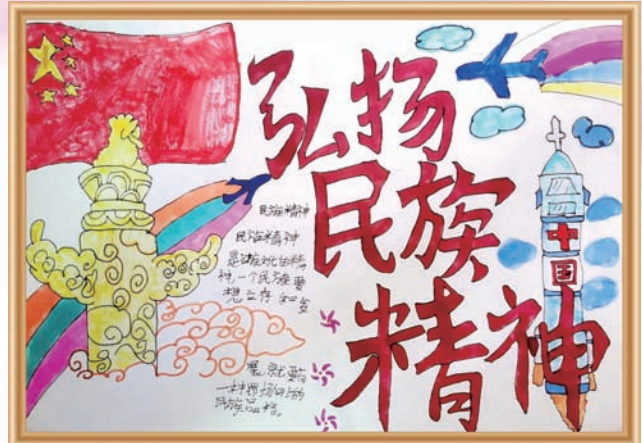
《弘扬民族精神》黄宝珠 12岁 家长 华南公司 黄温兴