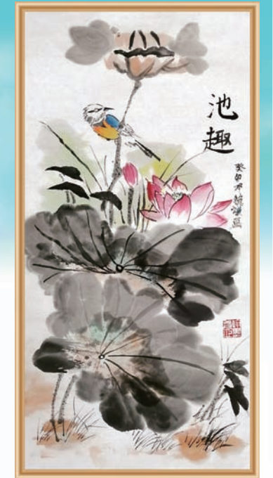
《池趣》邓敬谦 11岁 家长 直属工程公司 龚银