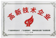
高新技术企业 National High-Tech Enterprise