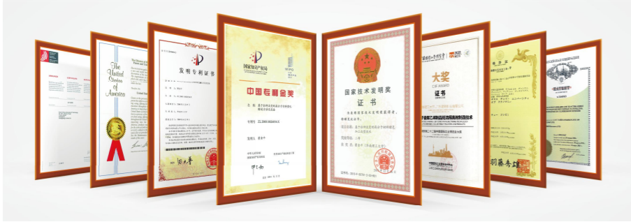
中国发明专利金奖、国家技术发明奖、专利证书 China Invention Patent Gold Award, National Technology Invention Award, Patent Certificates