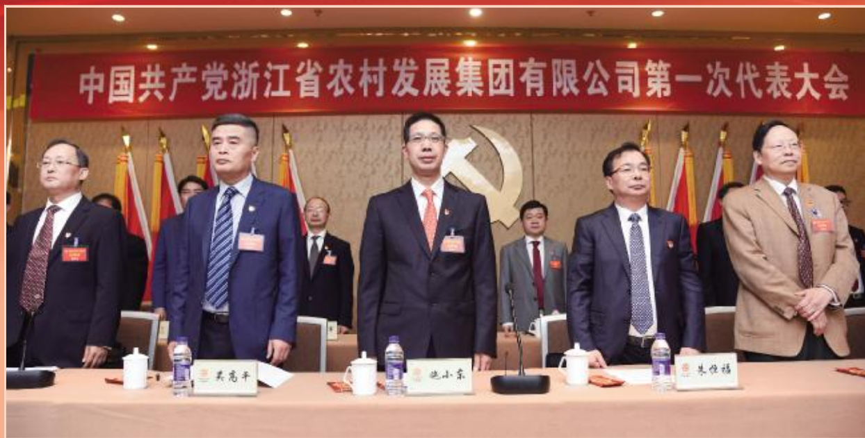
农发集团第一次党代会在雄壮的国歌声中正式开幕