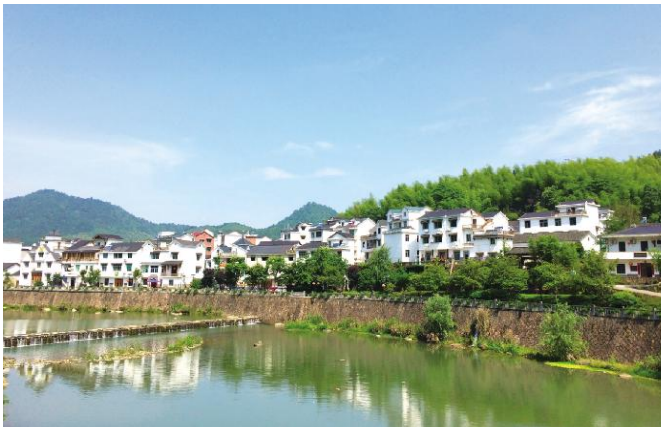
青山绿水环抱中的美丽乡村——下姜村