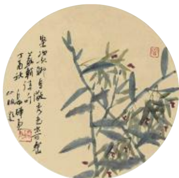
坚姿聊自傲，秀色亦堪餐