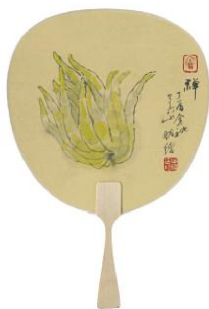
金华佛手奇异之果