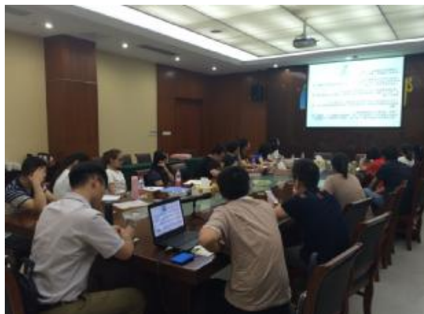
婚庆专业知识学习