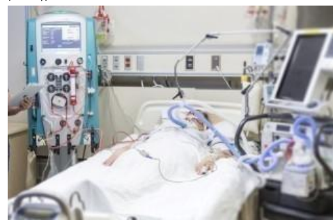
CRRT专用型体外循环血路