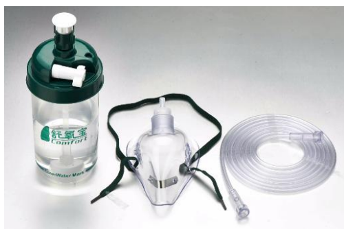
一次性使用一体式吸氧管