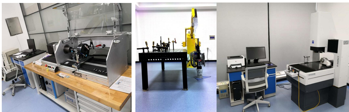
图表 7 公司行业先进实验检测设备