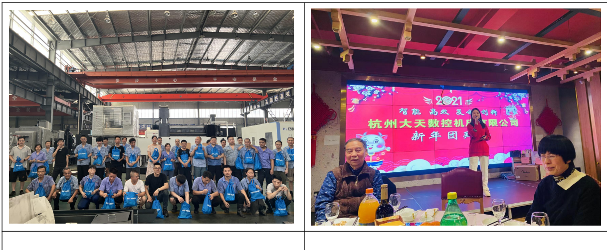
图表 8 员工活动图

建立了员工满意度管理制度，通过多种途径来识别影响员工满意的因素。针对不同的员工群体采用适当的方式，包括组织部门会议、职工代表会、新进员工座谈会、离职员工访谈，收集员工抱怨和投诉，开展专项调查等多种方式来识别影响员工满意的关键因素，最终确定影响整体员工满意的关键因素。