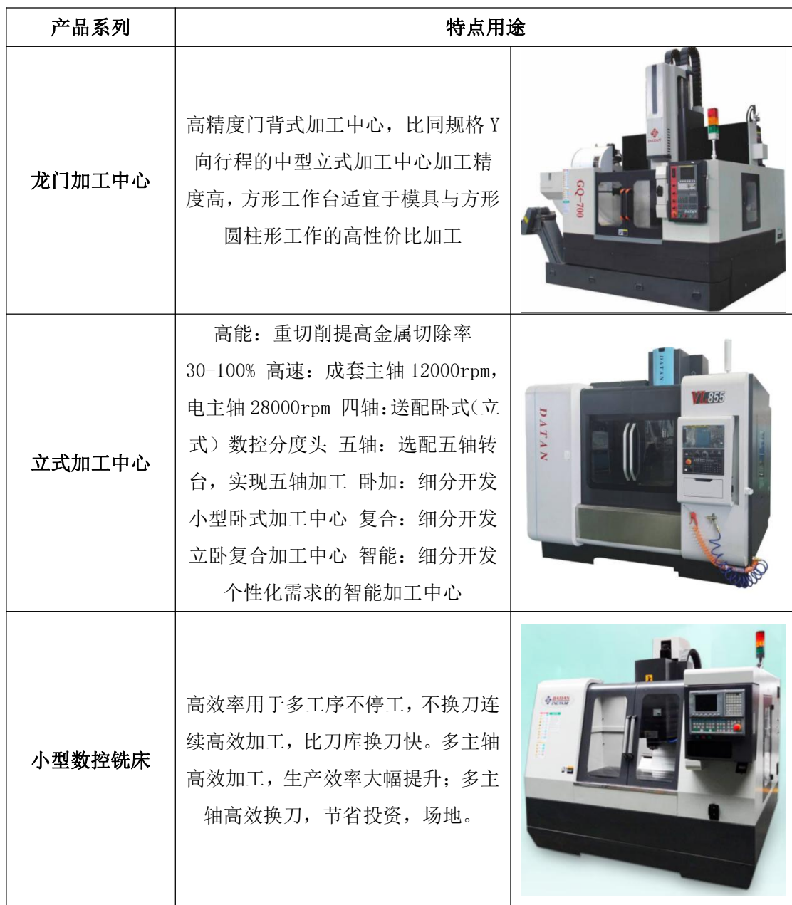
图表 2 公司产品种类及用途