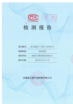
图表 10 环境监测报告