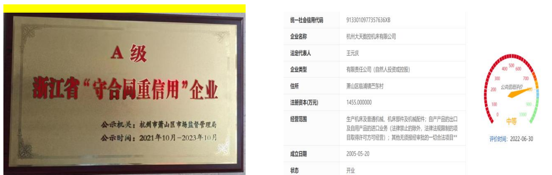
图表 14 道德行为相关结果

公司一直以来坚持诚信为本，依法经营，信守职业道德，树立了良好的商业信用和道德形象，获得顾客、供应商、政府、质监、工商、税务、银行等的广泛好评，赢得了社会各界高度认可。