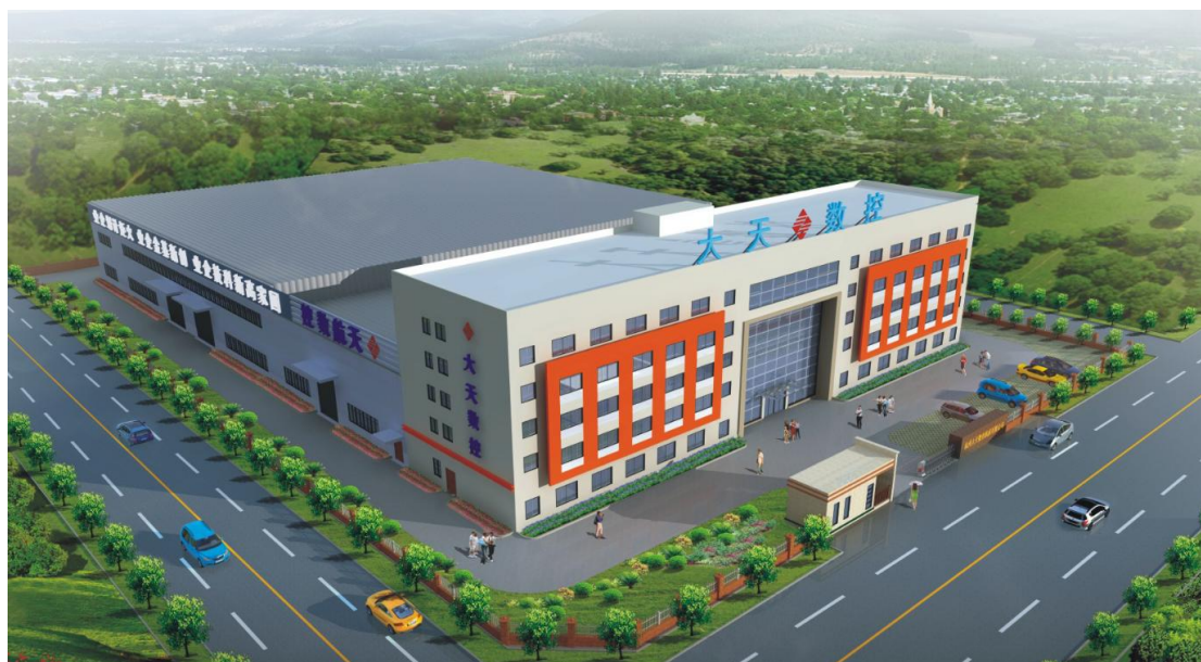
图表 1 公司总部厂区图

通过不断努力，公司取得良好的经营业绩。同时也得到了政府与社会的肯定，近几年获得荣誉，如下：