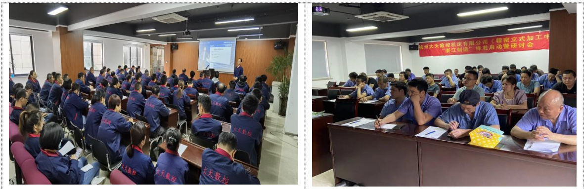
图表 7 员工培训

根据公司战略规划要求，为了更好的实现长短期战略目标和规划，根据绩效测量、绩效改进和技术变化的要求制定员工教育、培训计划，在分析各种需求与员工现有能力基础上，根据人力资源规划制定，“为每一个岗位的发展提供机会，为每一个员工的攀登创造条件”，我们本着“以德为先，以才为重，德才兼备，知人善用”的用人理念，将其作为建立完善培训管理体系的依据。