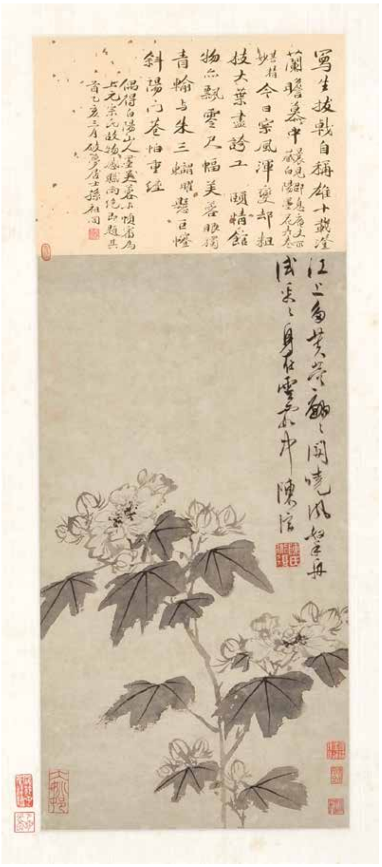
【作者】陈淳 【名称】白芙蓉轴 【规格】纸本水墨 纵50.7厘米，横27.3厘米 【年代】明 【藏地】中央美术学院美术馆藏