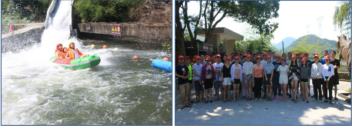
丰富多彩的文体活动

要体现在我们努力为员工创造舒适的工作环境和生活环境，如办公室和车间、食堂和宿舍、运动和休闲、阅读及娱乐等等。除了硬件保障之外，我们还通过诸如劳动技能竞赛、员工聚餐和文娱活动等员工活动来调动员工的工作激情，丰富员工的业余生活，获得了员工的广泛好评。如下图：