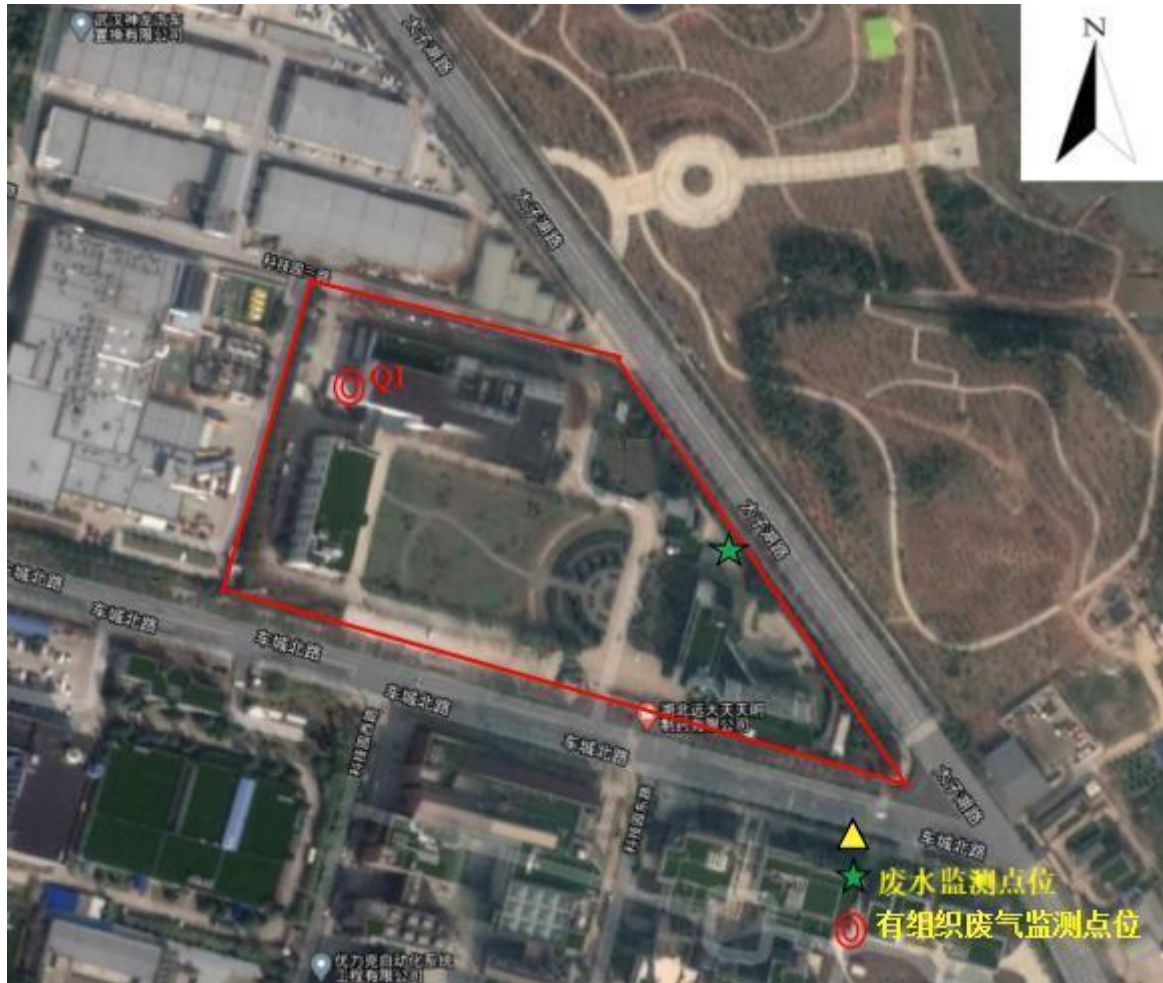
附图 1 检测点位图