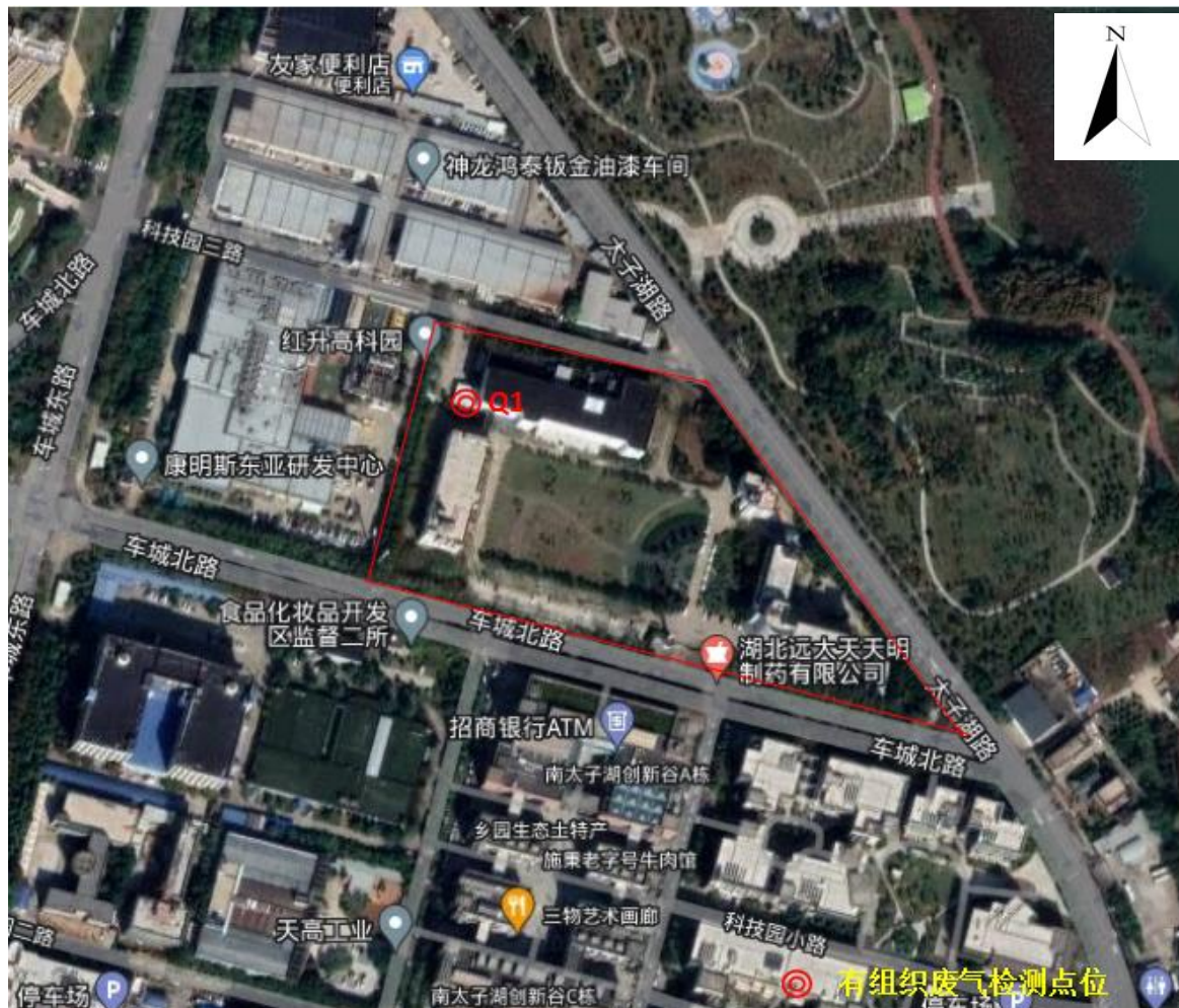
附图 1 检测点位图