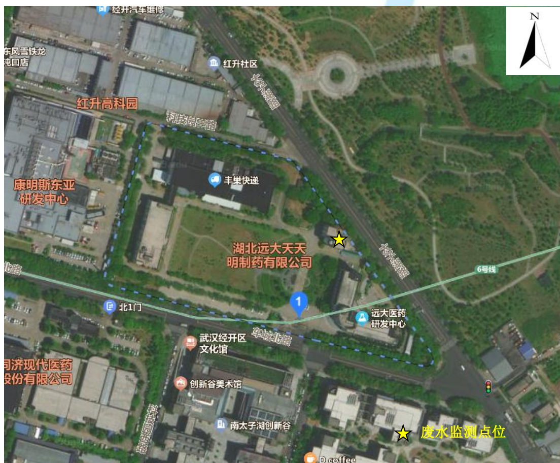
附图 1 检测点位图