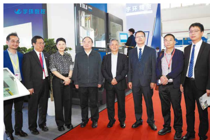
（左四为中国工程院院士、原院长周济到公司展位参观指导）

机床被称为“工业母机”，是制造机器的机器。高端数控机床的技术水平，更是衡量一个国家核心制造能力的标准之一。数