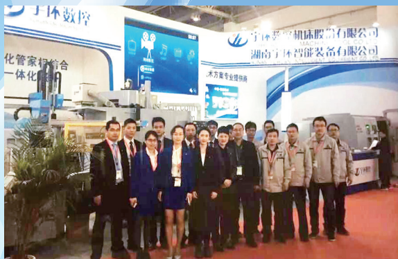
公司参展团队合影

2015年4月20日—25日，第14届中国国际机床展览会在北京召开，宇环数控携最新研发的高精密机床装备和自动化制造生产线等产品集中参展，凭借高智能化、高效率和高精度等特性倍受瞩目。