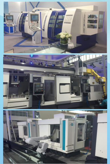
宇环智能的时代已经到来，让我们期待宇环智能美好明天的到来。（宇环智能 钱兵）

在切身感受现代工业发展的魅力后，我感觉到现代工业自动化的发展，已经成为智能制造和工业自动化的关键技术和重要产品，本届数控机床展，展示的不仅仅是机床，展示的是为用户提供全面解决方案，保证精度和提高效率的同时，降低制造成本，解决客户的一切后顾之忧。这次观展给我留下了深刻的印象，也了解了当前科技的进步，智能、自动化的时代已经到来，