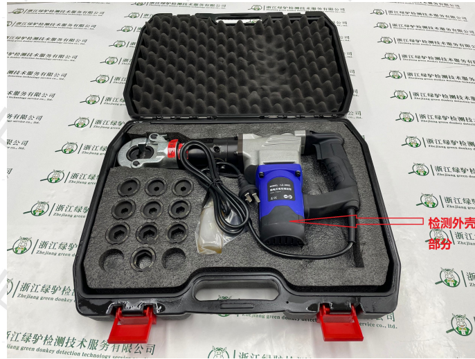
检测样品贴样（或者照片）