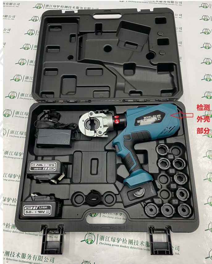
检测样品贴样 (或者照片)