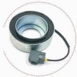
基本参数 Basic parameters